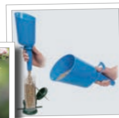
Fylletrakt Super Scoop Best.-nr. 00 513/7