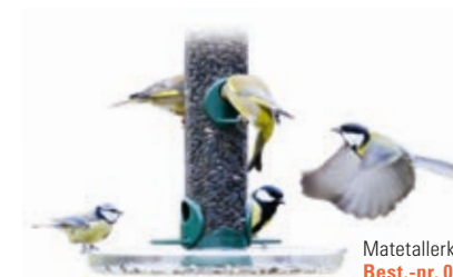
Matetallerken Best.-nr. 00 588/5