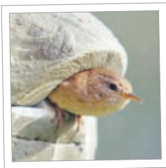
Gjerdemuttkule 1ZA Best.-nr. 00 200/6