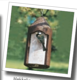
Hekkekasse 2M Best.-nr. 00 111/5