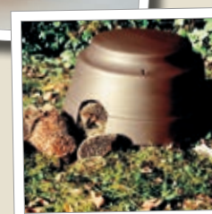
Pinnsvinkuppel Best.-nr. 00 390/4

Flere artikler og artikkelinformasjoner finner du i vår hovedkatalog som du kan bestille gratis eller få i faghandelen.