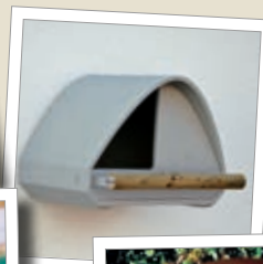
Tårnfalkhule 2TF Best.-nr. 00 255/6