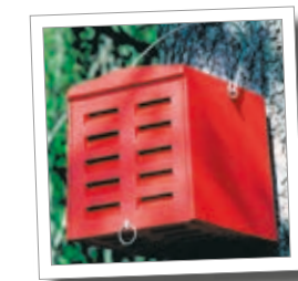
Gulløyekvarter Best.-nr. 00 385/0