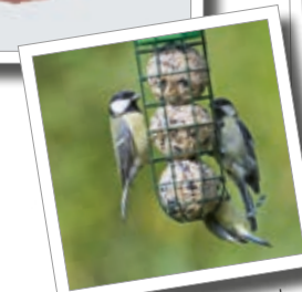
For meisebolle Matesøyle Best.-nr. 00 858/9