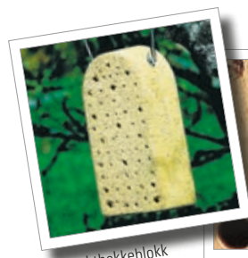
Insekthekeblokk Best.-nr. 00 375/1