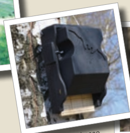
Flat flaggermuskasse 3FF Best.-nr. 00 239/6