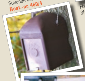
Sovende ekornreir 1KS Best.-nr. 460/4