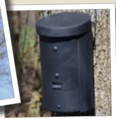
Storrom flaggermuskasse 2FS Best.-nr. 00 233/4