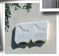
Flaggermus-fassadekvarter 1FQ Best.-nr. 00 760/5