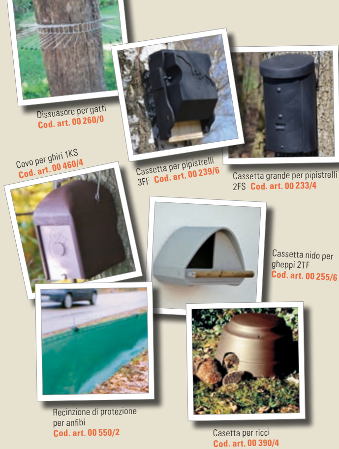
Dissuasore per gatti Cod. art. 00 260/0