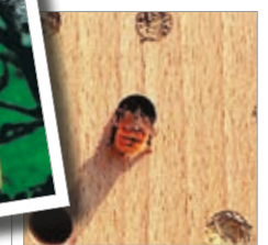
Nido per insetti Cod. art. 00 370/6