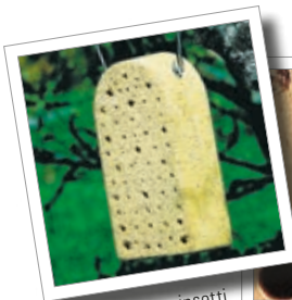
Blocco nido per insetti Cod. art. 00 375/1