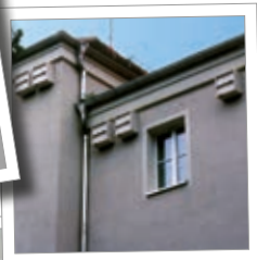
Cassetta per rondini e pipistrelli 1MF Cod. art. 00 615/8