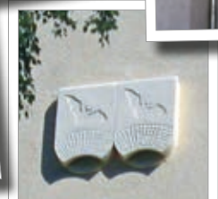
Cassetta da facciata per pipistrelli 1FQ Cod. art. 00 760/5