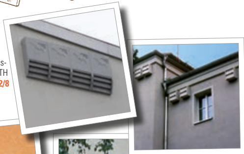
Gierzwaluw- vleermuis-kast 1MF Bestelnr. 00 615/8