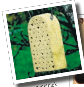
Insectennestblok Bestelnr. 00 375/1