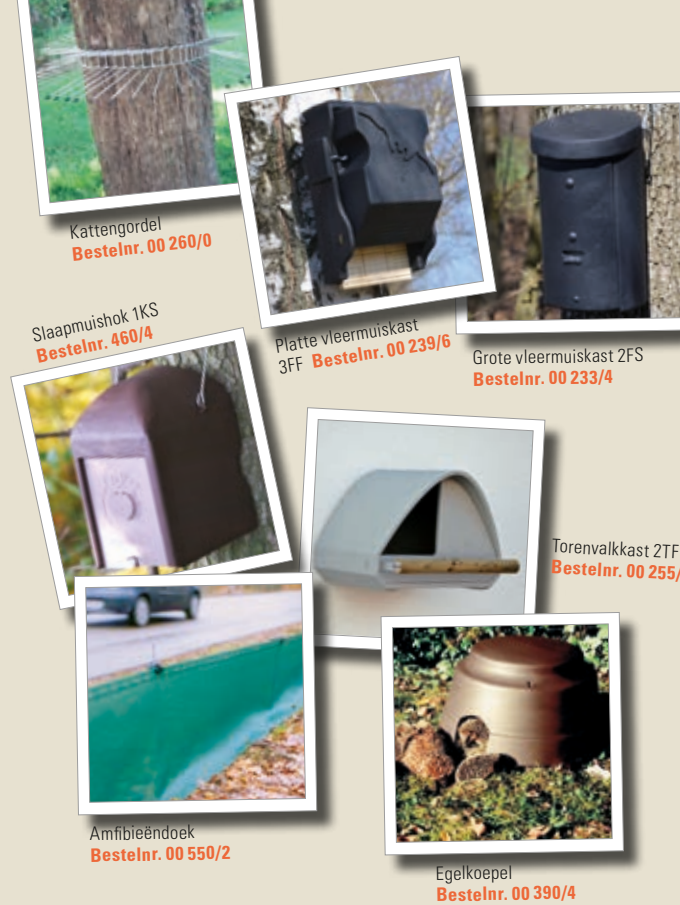
Kattengordel Bestelnr. 00 260/0