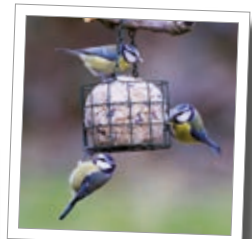
Ptačí krmítko – košík na maxi lojovou kouli Obj. č. 00 849/7