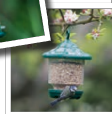
Ptačí krmítko – lucerna Obj. č. 00 800/8