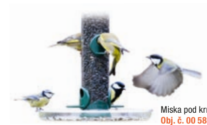
Miska pod krmítko Obj. č. 00 588/5