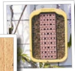
Včelky samotářky – dům z jilu a slámy Obj. č. 00 377/5