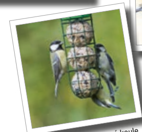
Ptačí krmítko na 3 lojové koule Obj. č. 00 858/9