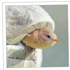
Ptačí budka 1MR na zeď Obj. č. 00 155/9

Rozvěšováním ptačích budek, ale i domečků pro hmyz a úkrytů pro netopýry lze významně přispět k biologické prevenci škůdců i k ochraně živočišných druhů!