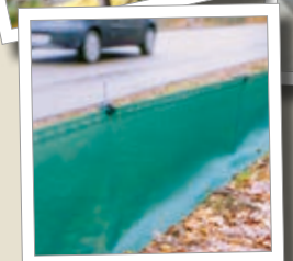
Zábrana pro obojživelníky Obj. č. 00 550/2