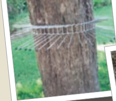
Ochrana budek a krmítek proti kočkám Obj. č. 00 260/0