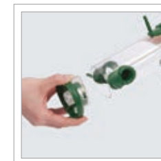
Ptačí krmítko – „The One“ Obj. č. 00 538/0

Krmení ptáků je báječnou příležitostí jak si vytvořit na zahradě nebo na balkóně živoucí oázu plnou potěšení.