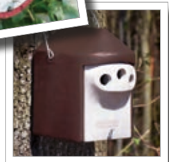
Ptačí budka 2M Obj. č. 00 111/5