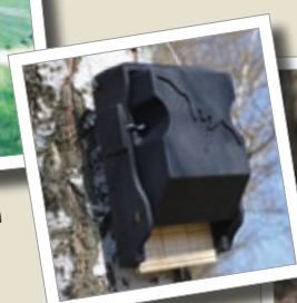
Plochá budka pro netopýři 3FF Obj. č. 00 239/6