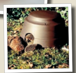
Domov pro ježky izolovaný – celoroční Obj. č. 00 390/4

Celý sortiment výrobků SCHWEGLER zakoupíte v internetovém obchodě www.zelenadomacnost.com , případně v naší prodejně