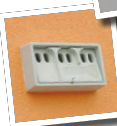
Ptačí budka 1SP - pro vrabce Obj. č. 00 590/8