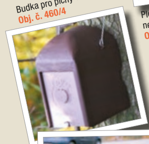
Budka pro plochu 1KS Obj. č. 460/4