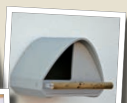
Hnízdní budka pro poštolky 2TF Obj. č. 00 255/6