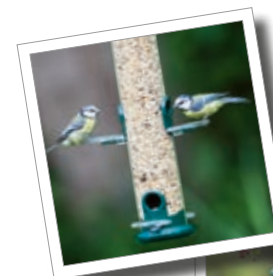
Ptačí krmítko – „Ring-Pull“ Obj. č. 00 586/1

Doplňování krmiva do tubusu je snadné díky pomůcce ve tvaru trychtýře, díky níž krmivo nepadá mimo krmítko. Zde je pouze malá ukázka ze široké nabídky našich výrobků.