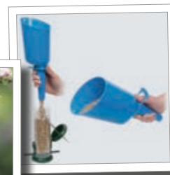
Chytrý pomocník při krmení ptáků Obj. č. 00 513/7