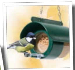
Ptačí krmítko „Flutter-Butter“ Obj. č. 00 544/1