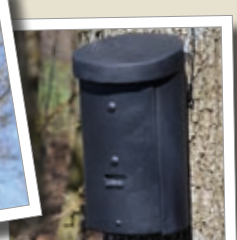
Budka pro kolonii netopýřů 2FS Obj. č. 00 233/4