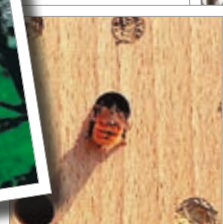
Hmyzí hotel z tvrdého dřeva Obj. č. 00 370/6