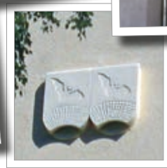
Budka pro netopýři 1FQ letní – na zdi domů Obj. č. 00 760/5