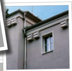
Budka pro rorýse a netopýři 1MF Obj. č. 00 615/8