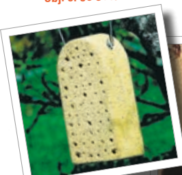
Včelky samotářky – dům z dřevocementu Obj. č. 00 375/1