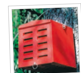
Velký dům pro zlatoočka Obj. č. 00 385/0

Většina druhů blanokřídlého hmyzu si svoje úkryty nehloubí ani neplní sama, nýbrž využívá již hotové skrýše. Proto jsou pro ně optimální hmyzí domečky s vhodnou náplní a optimální velikostí a tvarem otvorů.