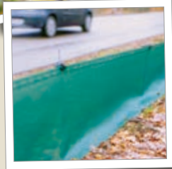
Beskyttelseshegn mod amfibier Best.-nr. 00 550/2