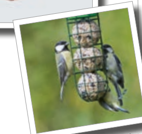
Fodersøjle til mejsekugler Best.-nr. 00 858/9