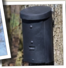
Storrumshule til flagermus 2FS Best.-nr. 00 233/4