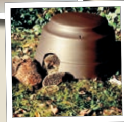
Pindsvin-kuppel Best.-nr. 00 390/4

Yderligere artikler og artikelinformationer fremgår af vores hovedkatalog, der kan rekvireres omkostningsfrit eller fås i specialforretninger