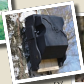
Flagermuskasse (flad) 3FF Best.-nr. 00 239/6