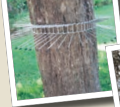
Katteskræmmer Best.-nr. 00 260/0