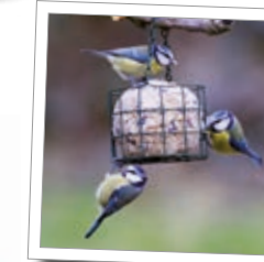
Foderkurv til foderkugler Best.-nr. 00 849/7