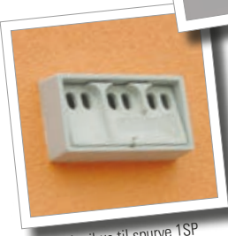
Kolonihus til spurve 1SP Best.-nr. 00 590/8