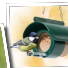
Flutter-Butter-Station til jordnøddesmørglas Best.-nr. 00 544/1