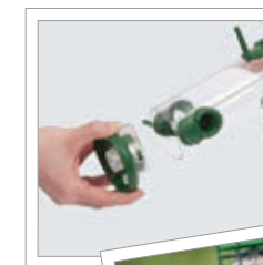
Fodersøjle „The One“ Best.-nr. 00 538/0

Fuglefodring er en vidunderlig mulighed for at skaffe en levende oase i haven eller på altanen samt for at glæde sig over dette.