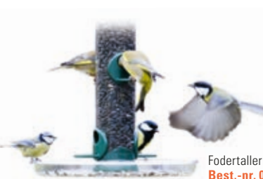
Fodertallerken Best.-nr. 00 588/5