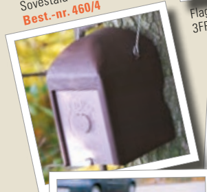
Sovestald 1KS Best.-nr. 460/4