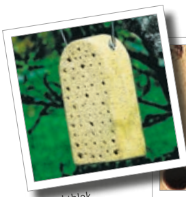
Insektblok Best.-nr. 00 375/1