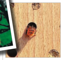
Insektræde i træ Best.-nr. 00 370/6