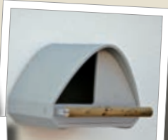
Tårnfalkehule 2TF Best.-nr. 00 255/6