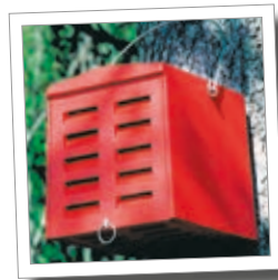
Abris à chrysope Réf. 00 385/0

La majorité des hyménoptères ne creusent pas eux-mêmes leurs abris mais occupent des galeries déjà existantes. C'est pour cela que les ruches avec des matériaux de remplissage et des percements adéquats sont optimales pour eux.