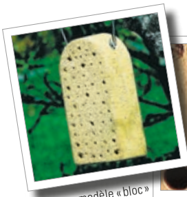
Ruche - modèle « bloc » Réf. 00 375/1