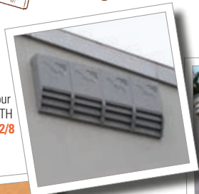
Gîte d'été universel pour chauves-souris 2FTH Réf. 00 772/8