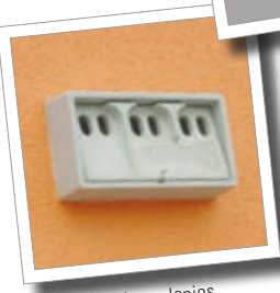
Abris pour les colonies de moineaux 1SP Réf. 00 590/8