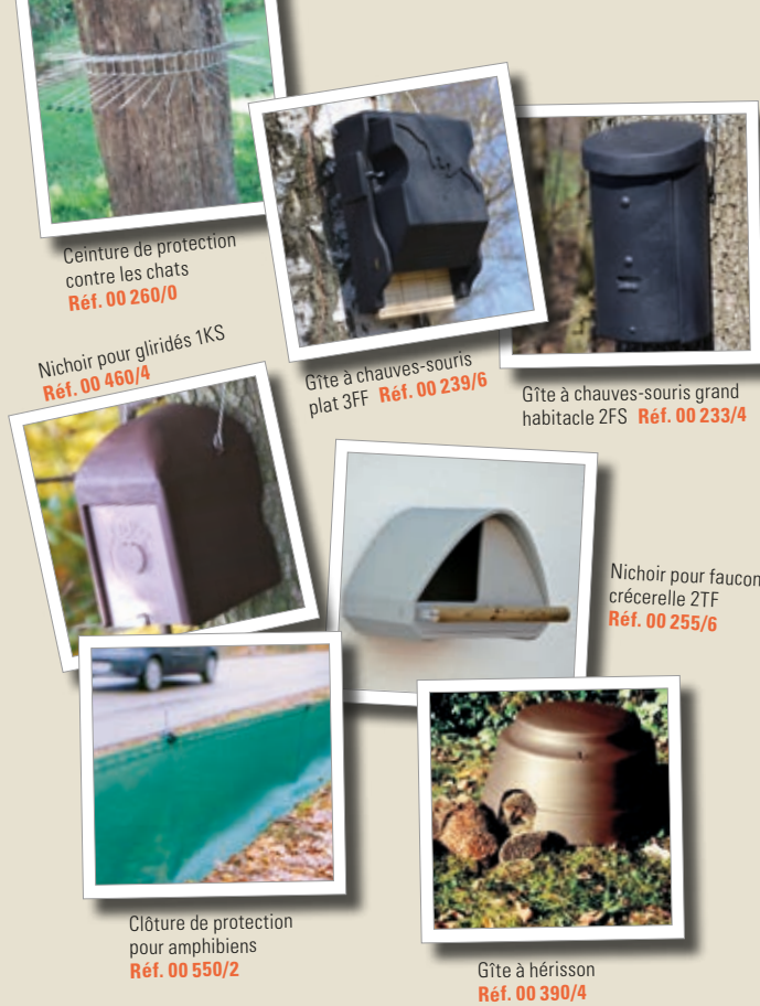
Ceinture de protection contre les chats Réf. 00 260/0