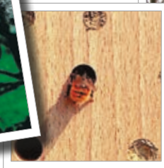
Ruche en bois Réf. 00 370/6