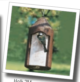
Holk 2M Best.-Nr. 00 111/5