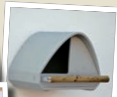
Tornfalkshåla 2TF Best.-Nr. 00 255/6