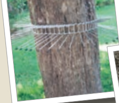
Klätterskydd Best.-Nr. 00 260/0

De flesta stekelararter borrar sina kvarter inte själva utan utnyttjar befintliga borrarade gångar. Därför är insektsvägg med korrekt påfyllning och borrhål optimala för djuren.