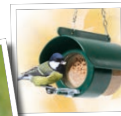
Foder-smör-station för jordnötssmörglas Best.-Nr. 00 544/1