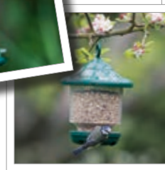
Foderlampa Best.-Nr. 00 800/8