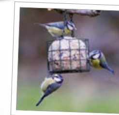
Foderkorg för stora Best.-Nr. 00 849/7