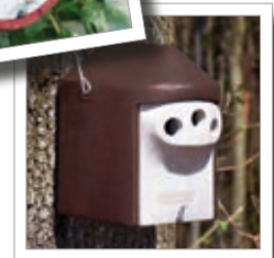
Holk ZGR Best.-Nr. 00 221/1