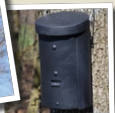
Flat fläddermuslåda 3FF Best.-Nr. 00 239/6