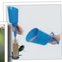
Påfyllningsträtt Super Scoop Best.-Nr. 00 513/7