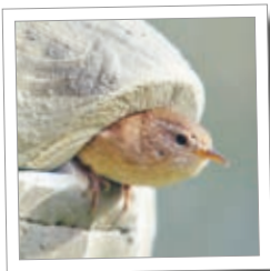
Kula för gärdsmyg 1ZA Best.-Nr. 00 200/6