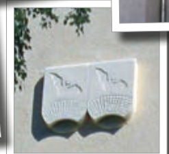
Fasadholk för fläddermöss 1FQ Best.-Nr. 00 760/5