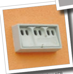
Hus för sparvkoloni 1SP Best.-Nr. 00 590/8