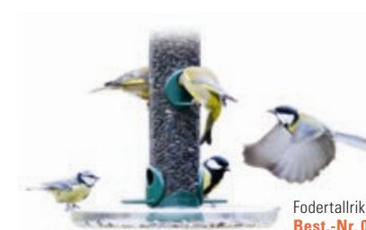
Fodertallrik Best.-Nr. 00 588/5