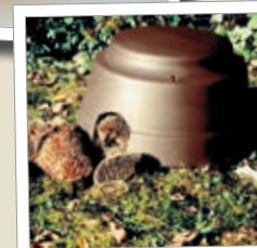
Kupa för igelkottar Best.-Nr. 00 390/4

Ytterligare artiklar och artikelinformation hittar du i vår huvudkatalog som kan beställas gratis eller fås i fackhandeln.