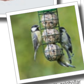
Foderpelare för talgbollar Best.-Nr. 00 858/9