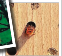
Insektsholk av trä Best.-Nr. 00 370/6